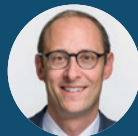
NATIONALRAT MARTIN CANDINAS

Ökonom, Autor, VWL-Professor an der Fachhochschule Nord- westschweiz, Privatdozent an der Universität St. Gallen